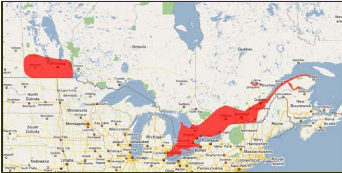
Figure 1 Zones de production de soja au Canada

Le climat tempéré et les sols fertiles de cette région sont des éléments clés dans la production d'un soja d'excellente qualité pour utilisation dans le secteur alimentaire. Le Canada est responsable de moins de 2 p. 100 de la production totale mondiale de soja, mais il est un fournisseur important de soja alimentaire spécial d'excellente qualité. Environ 35 p. 100 de la production du Canada est destiné à des marchés étrangers importants, comme le Japon et l'Europe.